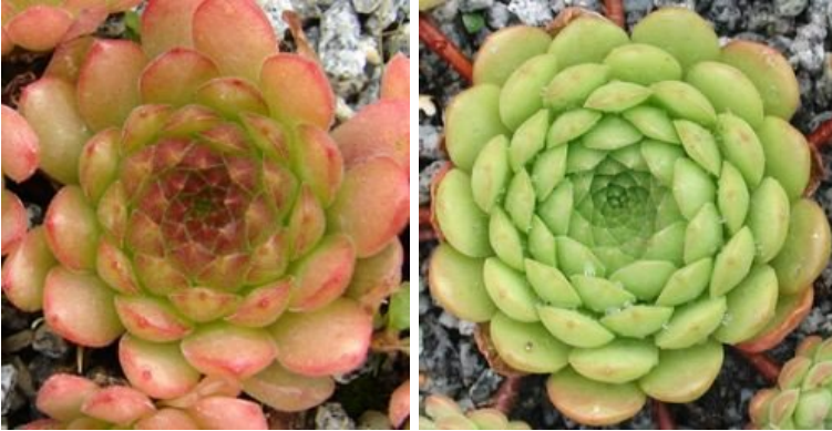
Abb. oben links: Anfang August; rechts: Ende Oktober 2007